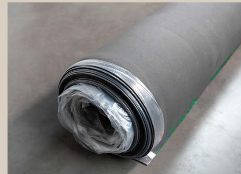
FOAM M034 (€ x m 2 )