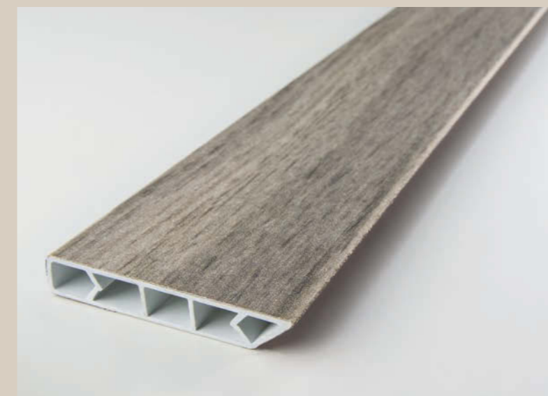
SKIRTING M033 (€ x m/l) RODAPIÉ